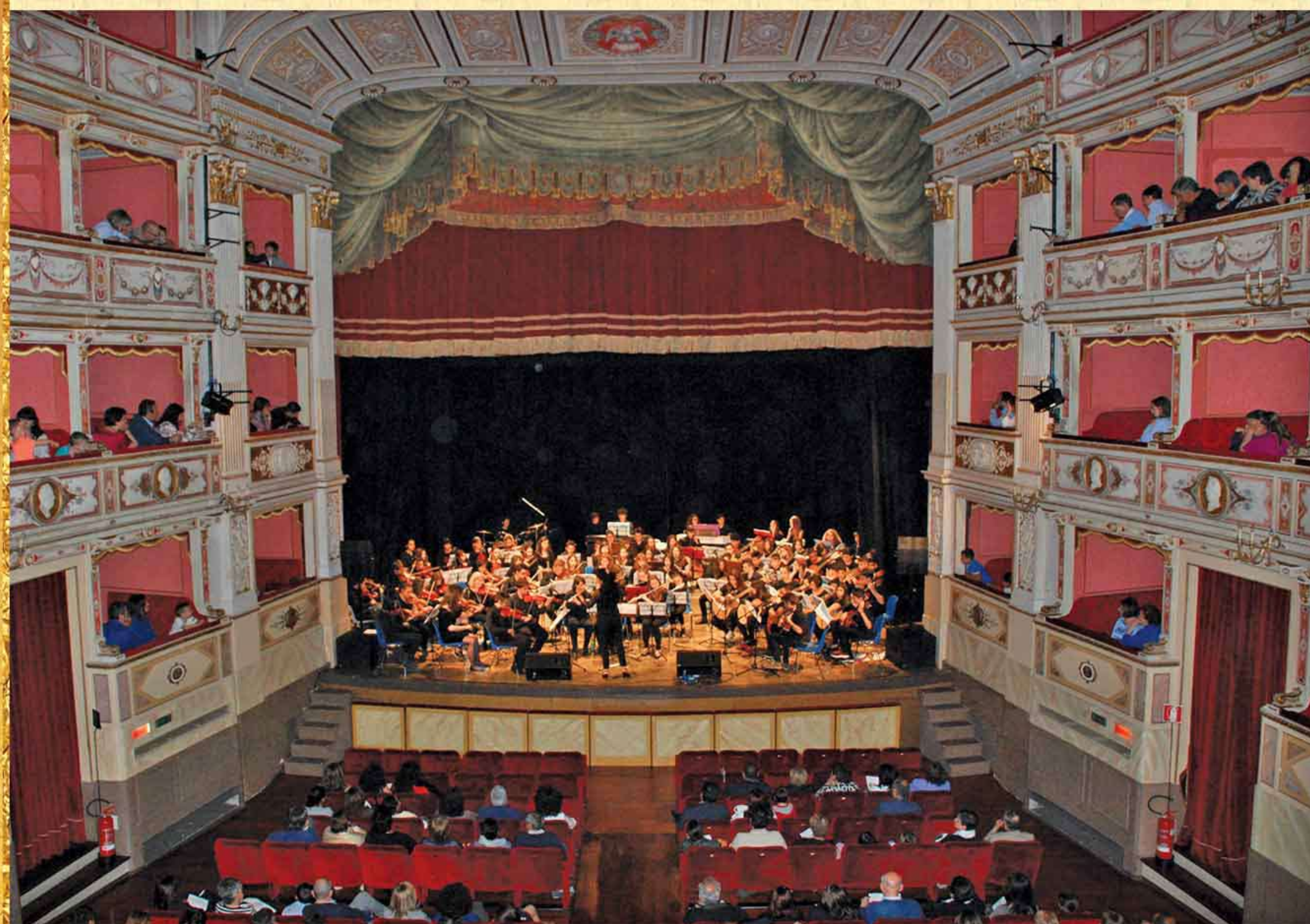
Orchestra delle Classi III della Scuola Secondaria di I Grado "Cocchi-Aosta" di Todi e del Liceo "Jacopone da Todi" di Todi