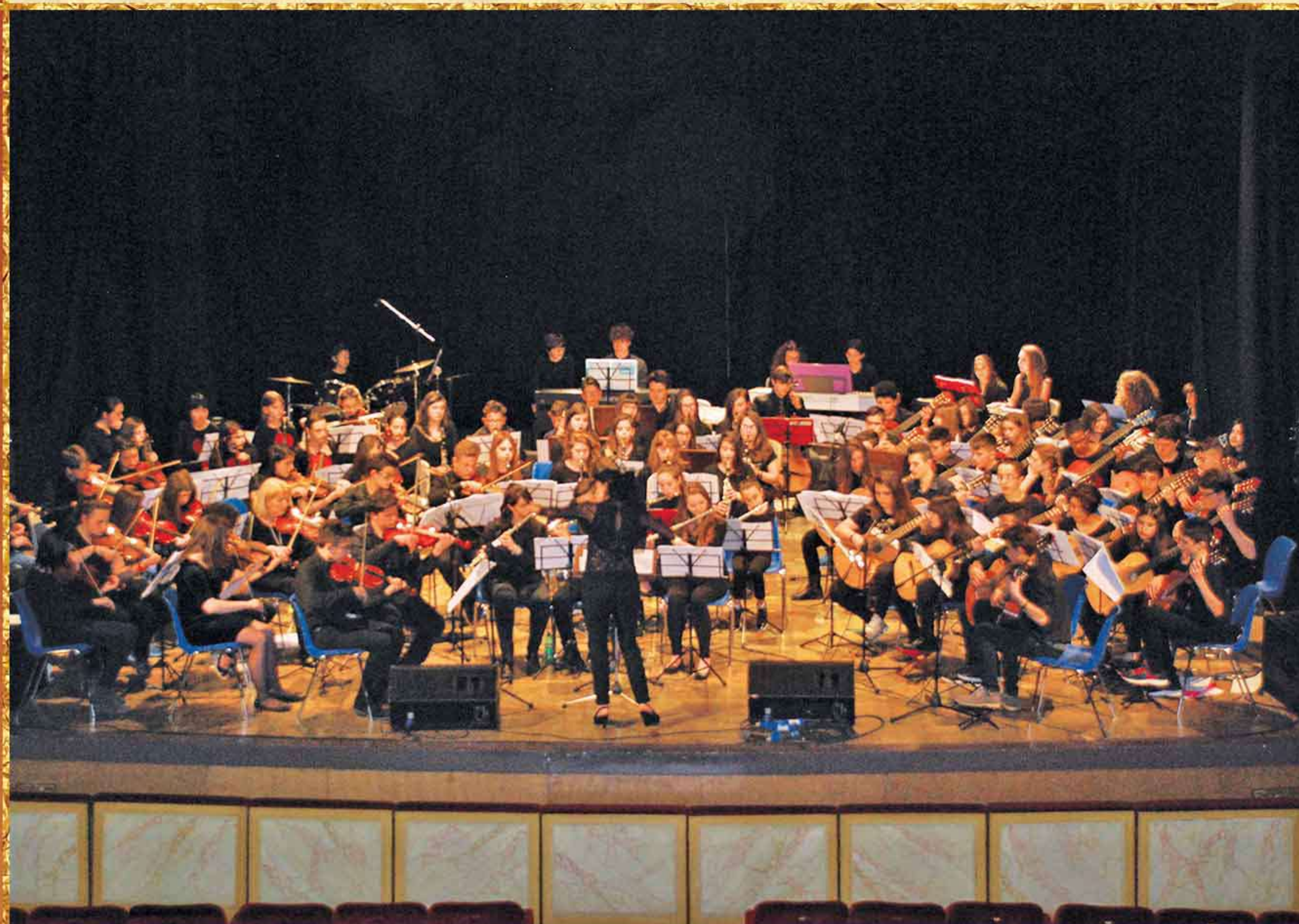
Orchestra delle Classi I e II della Scuola Secondaria di I Grado "Cocchi-Aosta" di Todi